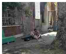
Sesso in strada, Trastevere solo l'ultimo caso /I precedenti