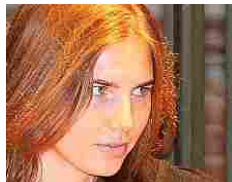
Ventimila dollari per un film porno, nuova proposta hard per