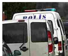
"Voleva fare come nei porno tedeschi": donna turca taglia la testa al