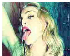
'Bitch I'm Madonna' da oggi on-line con cast stellare