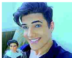
Addio al Ken umano, il modello brasiliano che amava le bambole /Foto