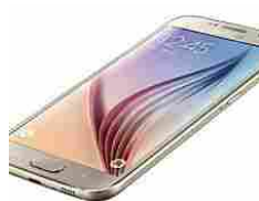
Samsung, vulnerabilità nella tastiera touch: a rischio 600 milioni di