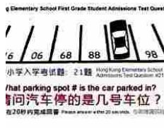
Questo test lo risolve anche un bambino, molti di voi non ci