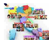
Amministrative 2015, speciale Adnkronos - A cura di Cristiana Deledda e Francesco Saita